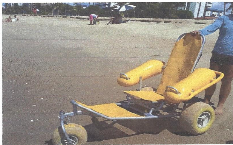
Modelo de Cadeira anfibia