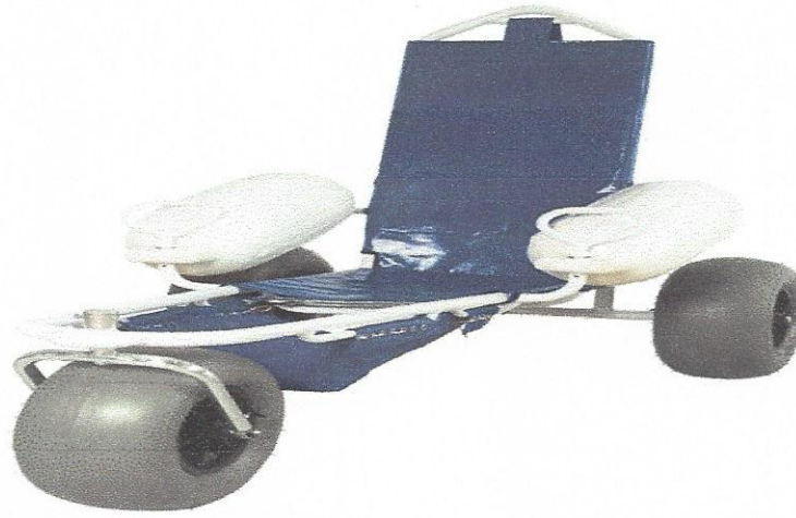
Modelo de Cadeira anfibia