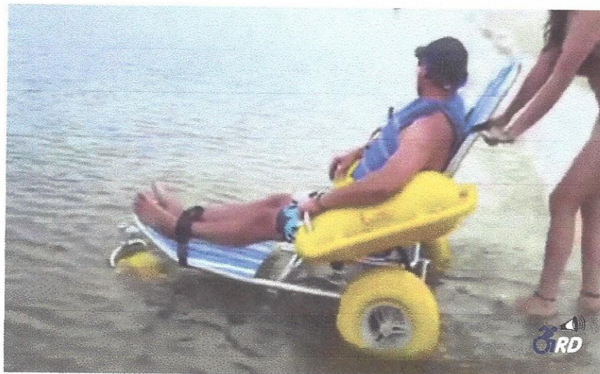
Cadeira anfíbia na água