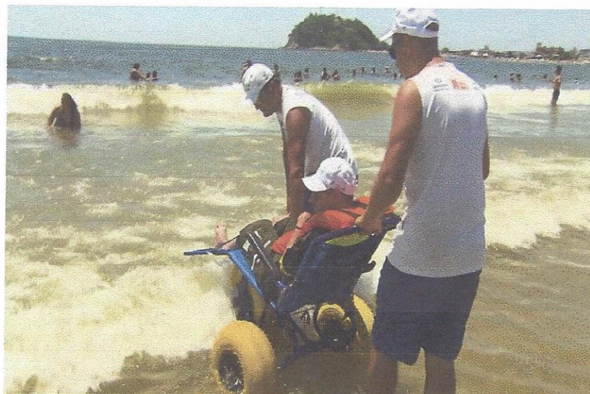
Cadeira anfíbia na água